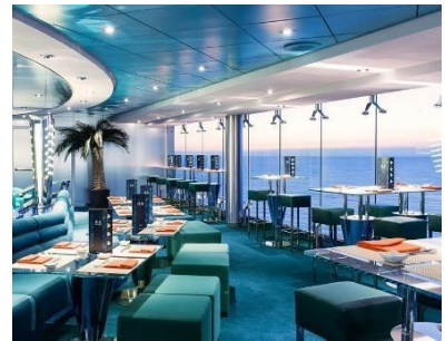
Kaito Sushi Bar