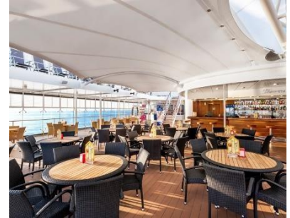
La Canzone del Mare Bar