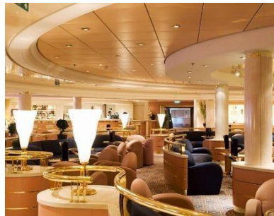
The Beverly Hills Bar