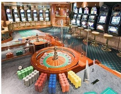
Las Vegas Casino