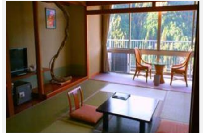
HOTEL MISUGI RESORT ***