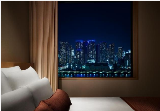
JAL CITY TOYOSU ****