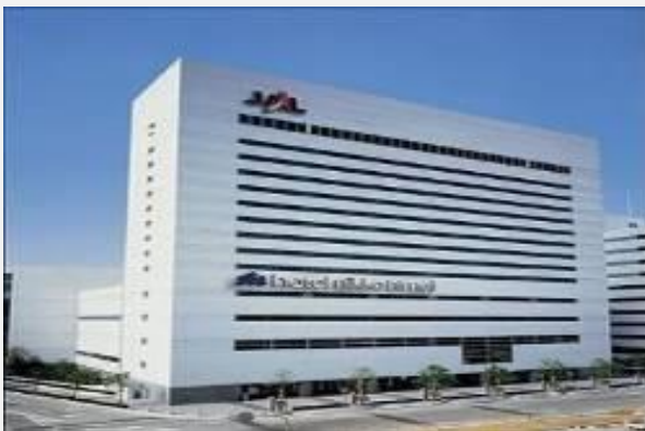
NIKO HOTEL ****