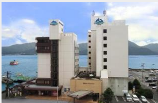
CORAL HOTEL ***