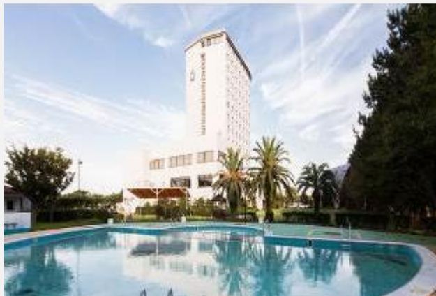
HOTEL HAMANAKO ROYAL ****